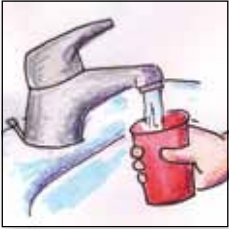
Becher mit Wasser füllen