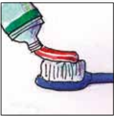
Zahnpasta auf die Bürste geben