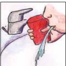
Mund mit Wasser ausspülen