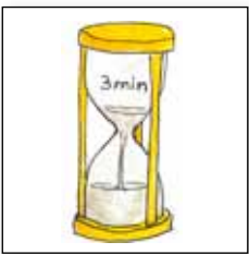
3 Minuten lang