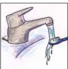
Zahnbürste mit Wasser abspülen